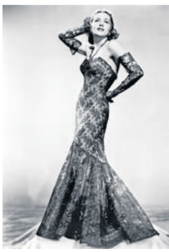
Joan Fontaine a remporté l'Oscar en 1941.

Née à Tokyo en 1917, Joan de Beauvoir de Havilland - son vrai nom - a été l'une des actrices les plus en vue de l'âge d'or hollywoodien. Sœur cadette de la comédienne Olivia de Havilland, avec