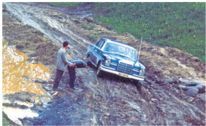
1964 En reportage en Roumanie. La Mercedes, plus costauda, a succédé à la Fiat Topolino.